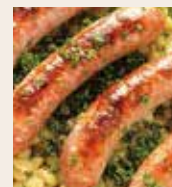
トウールーズソーセージ